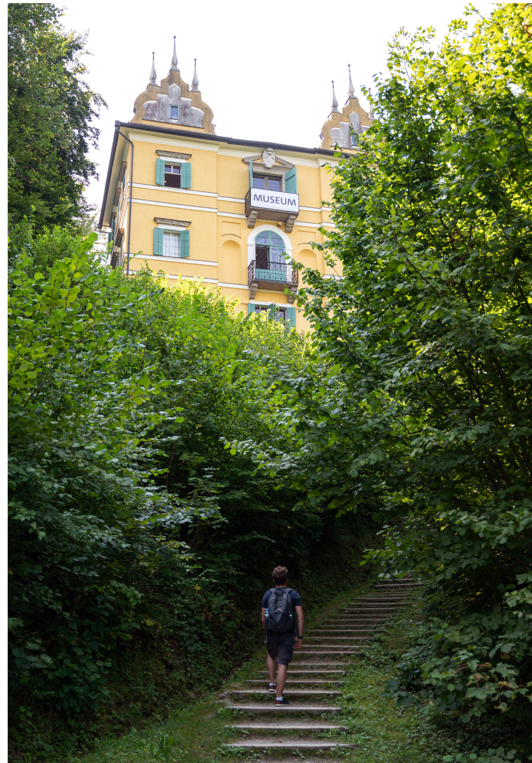
Noch bis 1. November geöffnet: das Volkskunde Museum im Monatsschlössl Hellbrunn.