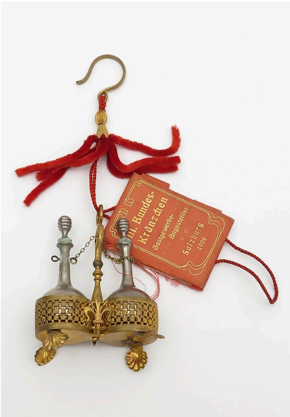
Nur ein Highlight aus der Ballspendensammlung des Salzburg Museum. August Klein, Ballspende (III. Bundeskränzchen Gastgewerbe-Angestellter in Salzburg), 1906