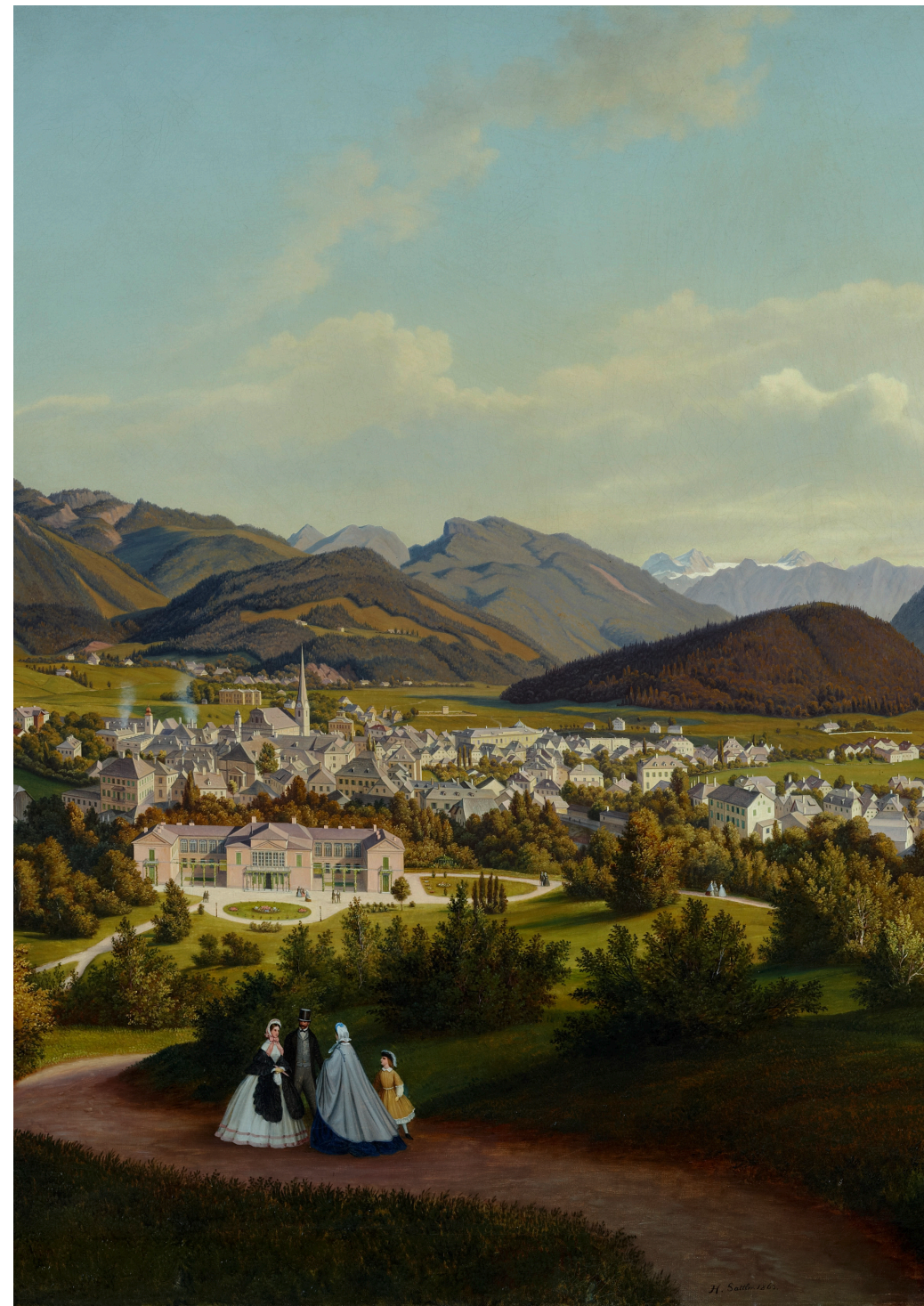
Ins Salzkammergut geht es bei der Exkursion des Museumsvereins am 11. Oktober. Hubert Sattler (1817–1904), Kosmorama: Bad Ischl mit der Kaiservilla (Oberösterreich), 1863, Öl auf Leinwand © Salzburg Museum

renate.wonisch-langfelder@salzburgmuseum.at , +43 662 620808-719