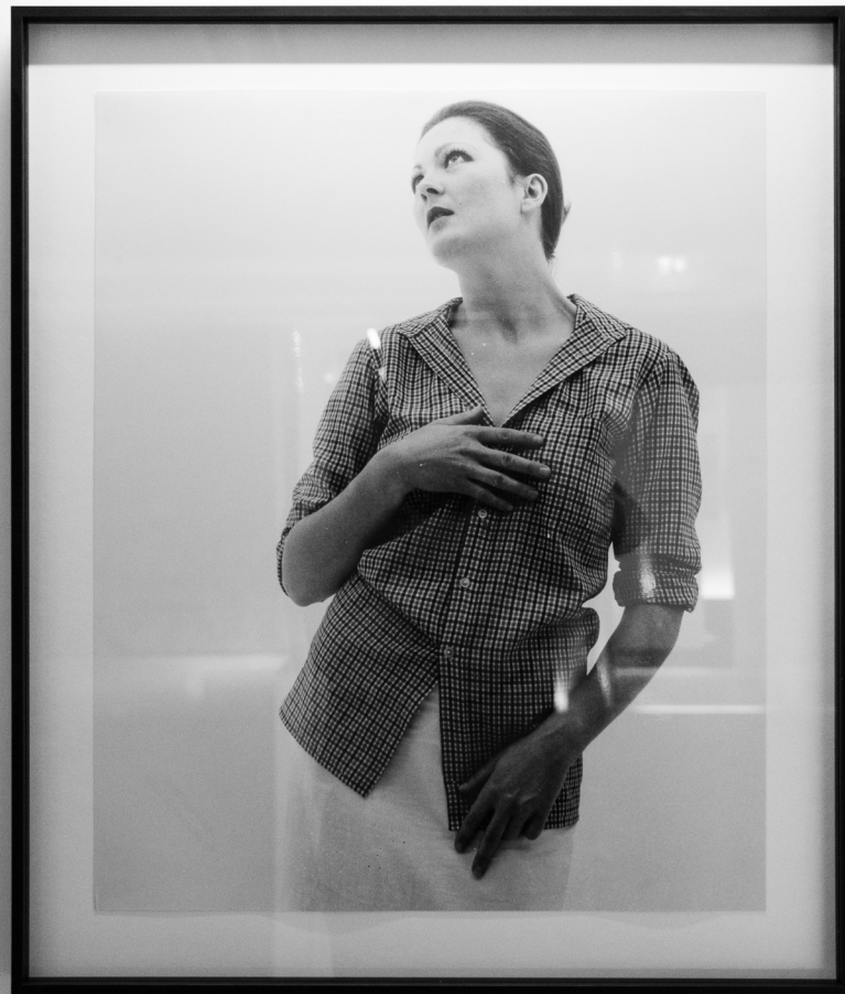
VALIE EXPORT Nonpareille, 1976 Incomparable, 1976 nach: Sandra Betschke: Der Frühling, 1477–1478 Schwarz-Weiß-Fotografie Exhibition Print 2024