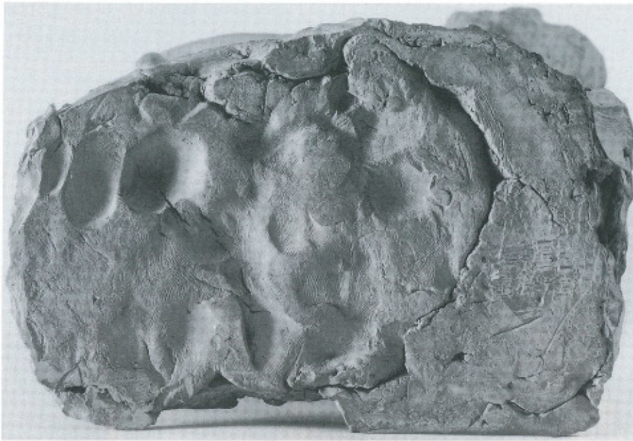
Abb. 2 (links): J. G. Mollinarolo, Lot und seine Töchter , Salzburger Barockmuseum (Unterseite).

mit guten Gründen als ihr Schöpfer vorgeschlagen werden?