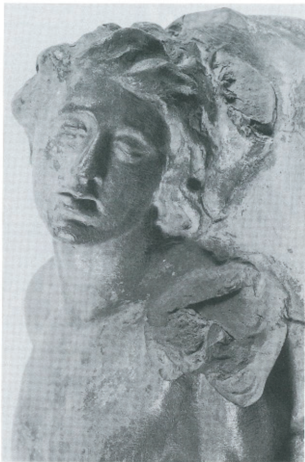
Abb. 22 (links): J. G. Mollinarolo, Liegender Jüngling , Baden, Rollett-Museum (Detail).