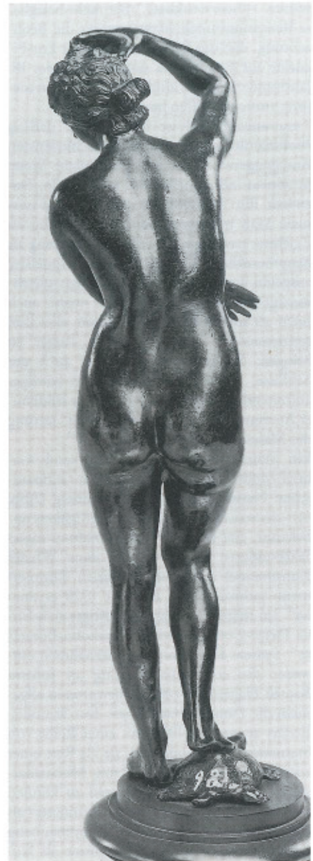
Abb. 10 (rechts außen): Florentinisch (?), Mitte des 16. Jahrhunderts, Venus auf der Schildkröte , Wien, Kunsthistorisches Museum, Kunstammer (Rückansicht).

seph de France, ehe sie 1808 mit anderen Teilen seiner Sammlung vom Hof für das k. k. Münz- und Antikenkabinett erworben wurde 77 .