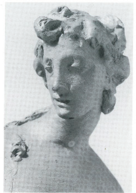
Abb. 12 (rechts außen): J. G. Mollinarolo, Allegorische Figurine, Nürnberg, Germanisches Nationalmuseum (Seitenansicht von rechts).