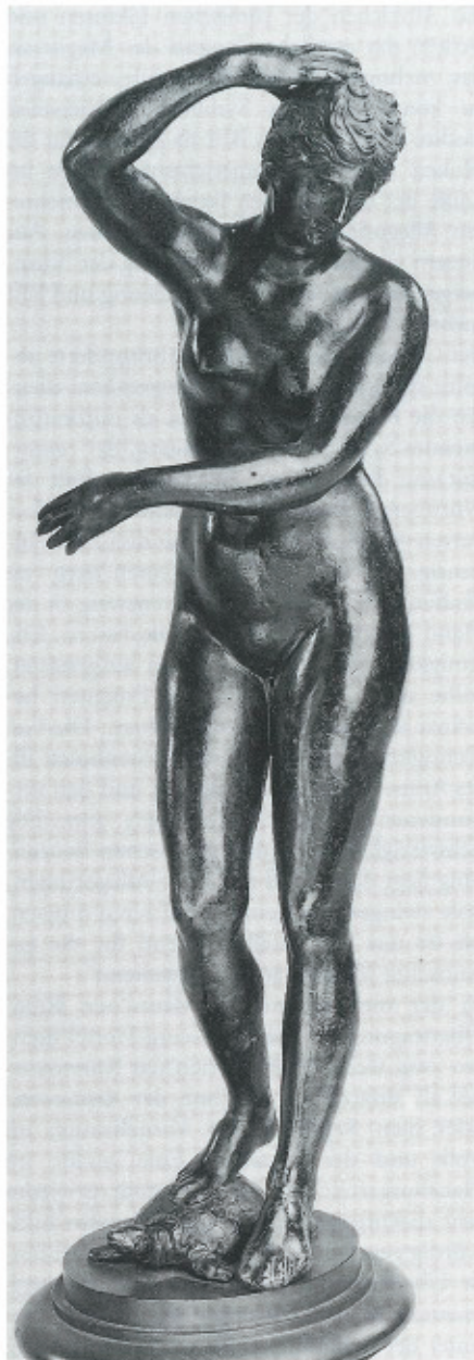
Abb. 9 (rechts innen): Florentinisch (?), Mitte des 16. Jahrhunderts, Venus auf der Schildkröte , Bronze, Wien, Kunsthistorisches Museum, Kunstammer.

Abb. 8 (links innen): J. G. Mollinarolo, Allegorie einer Jahreszeit (Herbst?) , Bleilegierung, Berlin, Staatliche Museen, Preussischer Kulturbesitz, Skulpturengalerie (Detail).