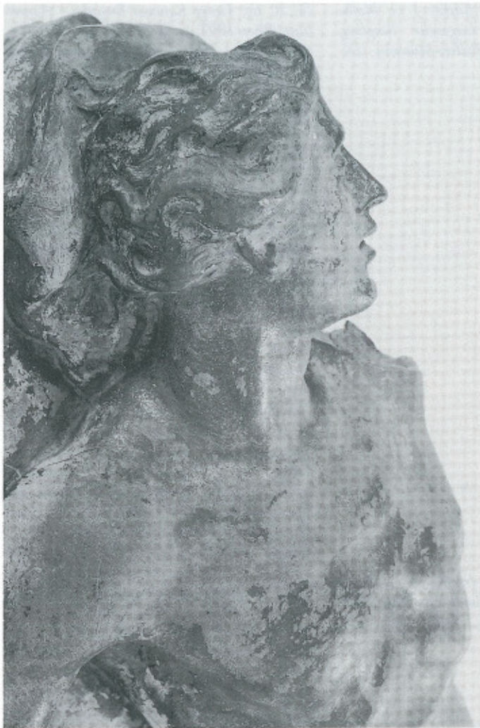
Abb. 20: J. G. Mollinarolo, Liegender Jüngling , Baden, Rollett-Mus. (Detail).