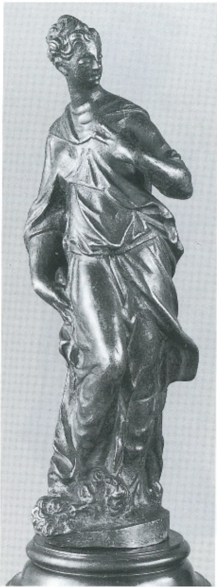
Abb. 16: Tiziano Aspetti, Judith, Bronze, Wien, Kunsthistorisches Museum, Kunstkammer.

stellungsumriß einräumte. Hagenauer steigerte seine die Leiber bedeckenden Gewandformen nicht zu autonomen, vom menschlichen Körper unabhängigen Massen. Dagegen entwickelt die Draperie in der Figurine des Mollinarolo, zusätzlich zu den anliegenden, von charakteristisch querenden Faltenzügen unterbrochenen Bereichen, ungleich mehr raumgreifendes Eigenleben (vgl. Abb. 14). Aus diesem Spannungsverhältnis zwischen den den Leib nachmodellierenden Abschnitten und dem zu einem eigenen skulptierten Gebilde verselbständigten Stoffvolumen an der Seite resultiert ihr Erscheinungsbild. Die gestalterische Lösung, dem mächtigen Attribut die Draperie als optisches Gegengewicht in der Hauptansichtsseite entgegenzusetzen, entspricht einer Kompositionstendenz, die bei Mollinarolo öfters anzutreffen ist 66 . Die als Argument für Hagenauer ins Treffen geführte Längung der Figuren ist allgemein dem in Wien im dritten