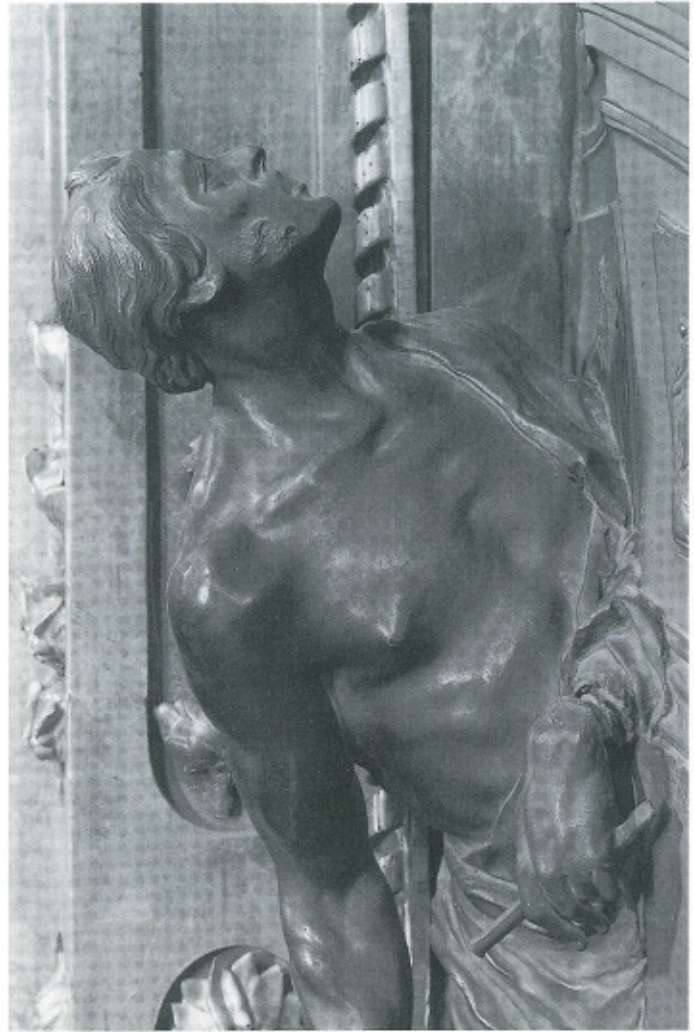
Abb. 21: J. G. Mollinarolo, Ladislaus-Altar , Bleilegierung, Győr, Dom (Detail).

Gattung beherrschte und seine Zeichnungen das übliche Maß vorbereitender Bildhauerzeichnungen in ihrer Qualität weit hinter sich ließen, belegen die erhalten gebliebenen Proben seiner Kunst. Er verstand es, ihnen eine auffällig malerische Note zu geben. Seine Art der abgestuften Lavierungen, durch die er die Illusionierung haptischer Formen und Körper erreichte, entsprach weit mehr der Zeichnungsart seiner gleichaltrigen Malerkollegen als typischen Bildhauerzeichnungen. Hier stand er dem Können eines Maulbertsch nicht nach 103 . Nicht von ungefähr war es möglich, daß dieser eine gezeichnete Invention einer skulpturalen Lösung Mollinarolos ident in eine freskierte Ausführung umsetzen konnte, wie es in der gemeinsam gestalteten Ausstattung der Franz-Regis-Kapelle in der Jesuitenkirche Am Hof in Wien praktiziert wurde, wobei diese Fähigkeit Mollinarolos nicht nur seiner vorbereitenden Entwurfsarbeit zustatten kam. Er erkor dieses Können jahrelang zu seinem hauptsächlichen Brotberuf. Fünf Jahre war er der Zeichenmeister der beiden Erzherzöge Ferdinand und Maximilian. Diesen Titel führte er