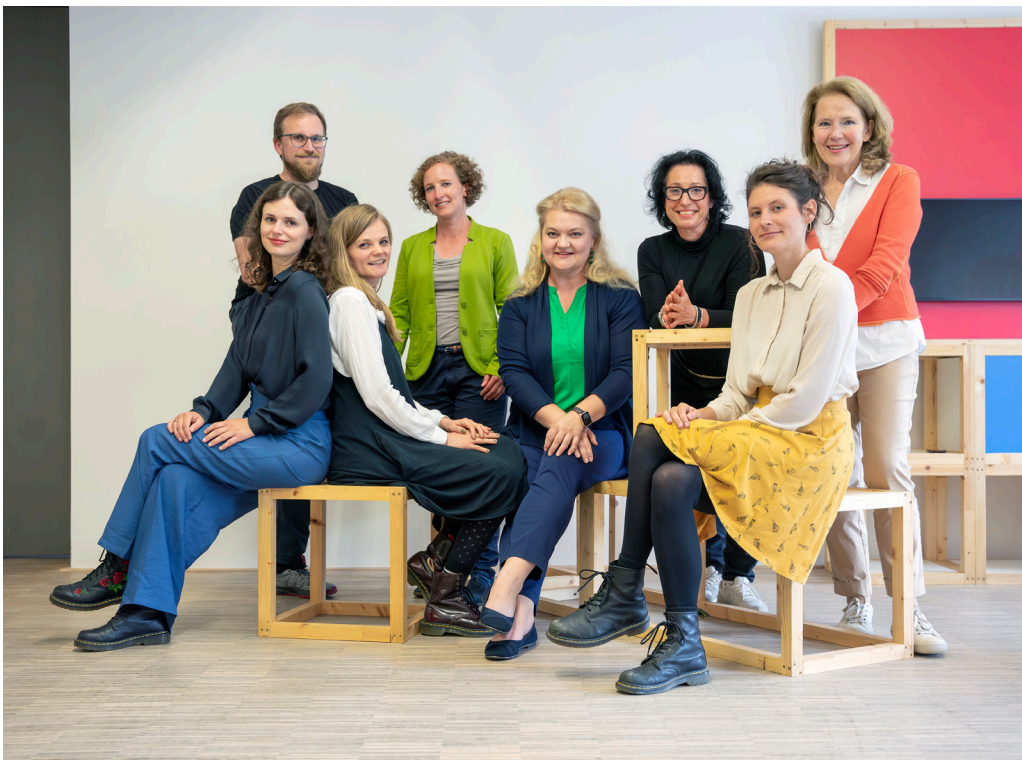
Das Team der Kunst- und Kulturvermittlung freut sich auf euren Besuch!