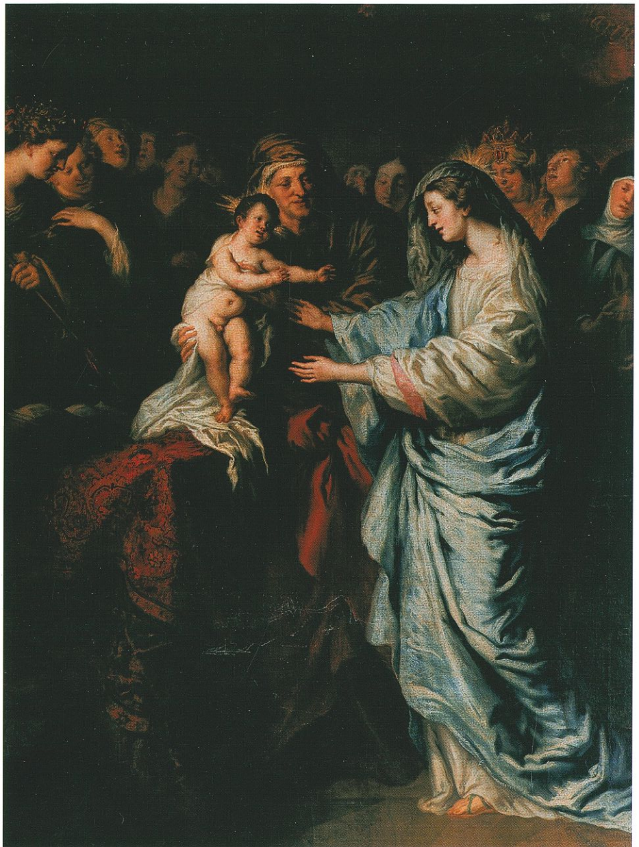
Abb. 3 (rechts): Joachim Sandrart, Die hl. Anna Selbdritt mit vielen Heiligen, Seitenaltar im Salzburger Dom

Wahl vorzuschlagen, und bei dem strengen Proporz, der sich im Laufe der Jahrhunderte in den Kapiteln hergestellt hatte, war dies auch meist erfolgreich. Dieses Verfahren stellt eine erste Erklärung dafür dar, daß oft mehrere Mitglieder einer Familie, etwa der Habsburger, der Wittelsbacher, der Schönborn, der Thun und vieler anderer mehr, nacheinander Domkapitulare in einer bestimmten Stadt waren.