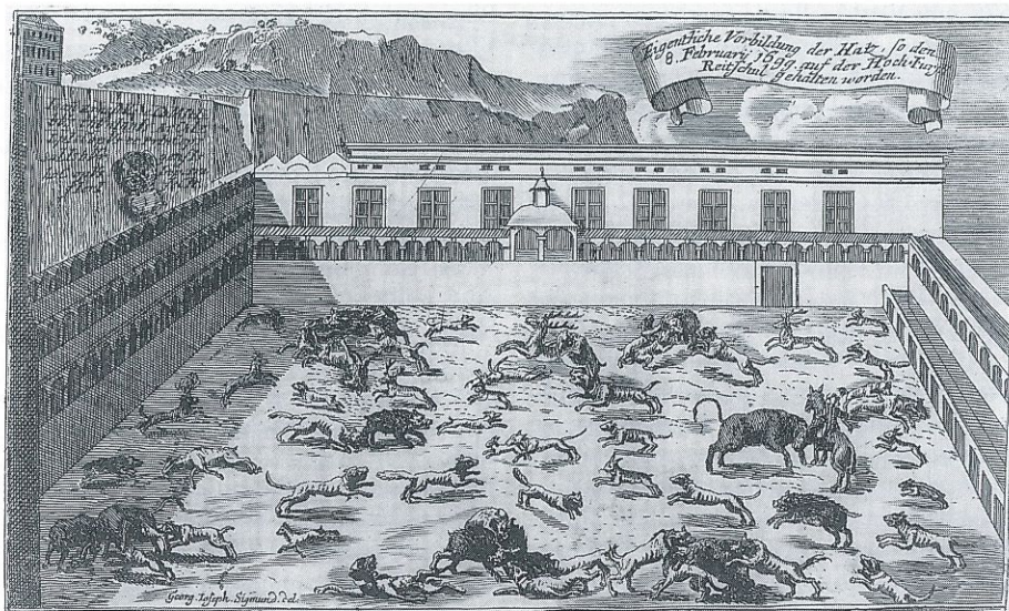
Abb. links: In einem abendländischen Jahrhundert wie dem 17., in dem jeder Untersuchungshäftling, vor allem bei den Inquisitionsgerichten, mit schweren Folterungen zur Erpressung von Geständnissen zu rechnen hatte, gab es auch besondere Formen von „Divertissement“: Bei festlichen Anlässen waren bei der Salzburger Hofgesellschaft Tierhatzen in der Felsenreitschule sehr beliebt, bei denen abgerichtete und ausgehungerte Kampfhunde auf Stiere und lebend gefangene Wildtiere gehetzt wurden – zur Appetitanregung dienten einige Hasen, auch ein Esel mit einer ihm aufgesetzten Puppe mußte sein Fell hinhalten. (Red.)