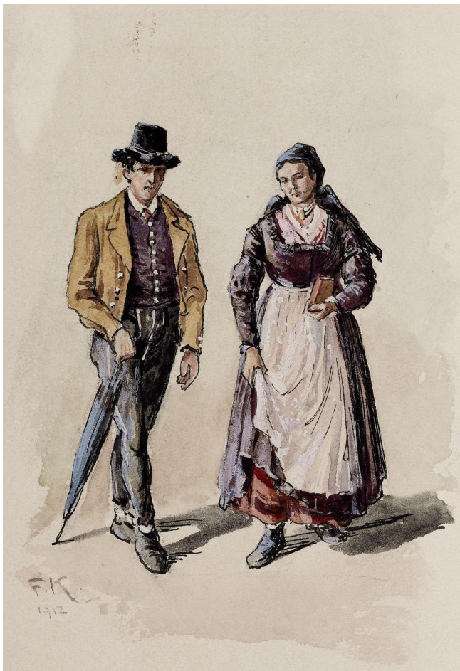
Franz Kulstrunk (1861–1944), Flachgauer Tracht, 1912, Aquarell, Tuschkfeder auf Papier © Salzburg Museum