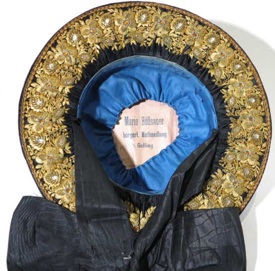
Dieser Trachtenhut ist auf der Unterseite mit Goldstickereien verziert. Johannes Bachl (Hutmacher), Frauenhut, um 1900