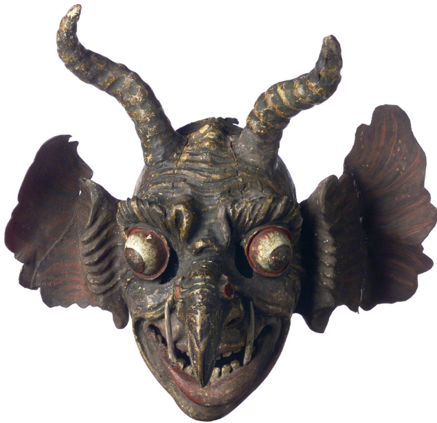
Diese Perchten- oder Teufelsmaske aus dem 18. Jahrhundert war 1858 die erste Maske, die in die Sammlung Volkskunde einging.

Bereits vor der offiziellen Eröffnung des Salzburger Freilichtmuseums hatte der Museumsgründer Kurt Conrad eine klare Vorstellung von der Gestaltung des Museumsgeländes am Fuße des Untersbergs. Im Herbst 1984 wurde das Museum mit 22 Gebäuden eröffnet, die im ganzen Land Salzburg abgetragen worden waren.