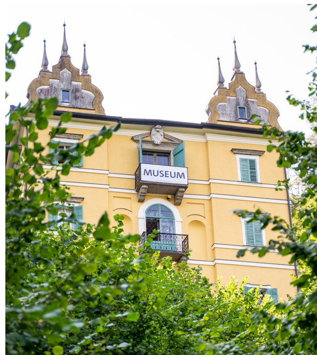
Das Volkskunde Museum im Monatsschlössl ist idyllisch auf dem Hellbrunner Berg gelegen.