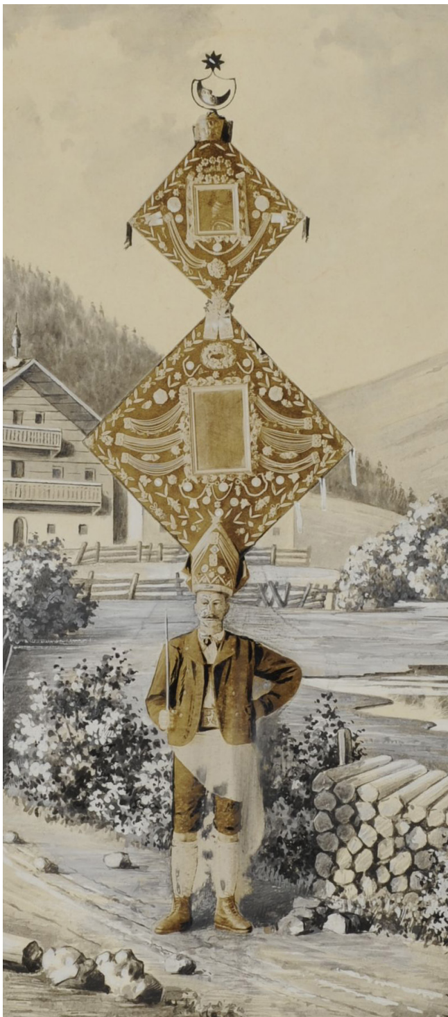
Pongauer Tafelpercht, um 1905, Federzeichnung, laviert, weißgehöhlt, mit Fotografie colligiert © Salzburg Museum