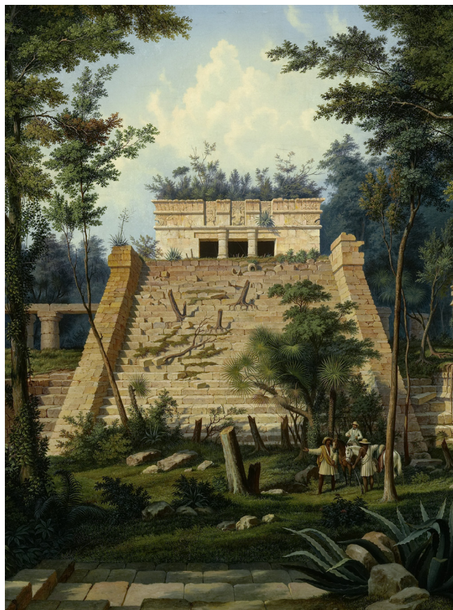
Das „Gastspiel“-Programm beginnt mit malerischen Ansichten von Hubert Sattler aus aller Welt. Hubert Sattler (1817–1904), Der Tempel El Castillo bei Tulum (Mexiko), 1856, Öl auf Leinwand